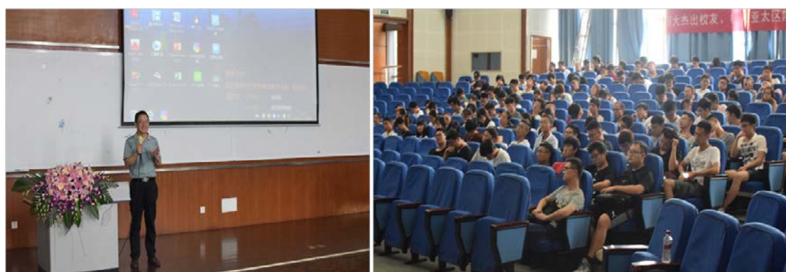
图 4. 实习动员会

为做好 2018 年的生产实习、认识实习、卓越工程师培训等实习工作，各系分别组织开展了教师和学生的实习动员大会，统一使用实习记录册，高水平实习基地实习率 100%。我院还组织青年教师到卓越工程师实习基地接受工程实践培训。另外，学院今年增加了 8 月份的实习队，所有实习队都高质量完成了实习工作。同时，我院获得 2017 年优秀实习队二等奖 1 项，三等奖 1 项；优秀指导教师二等奖 2 名。