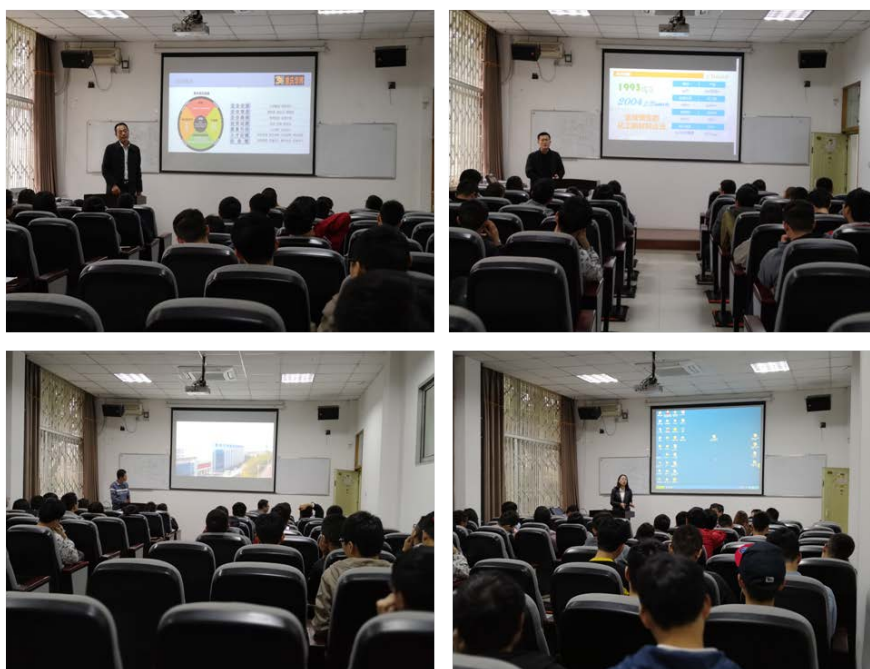
图 2. 卓越工程师教育研讨会现场

为提高学院卓越工程师培养质量，规范卓越工程师管理，2018年3月23日我院召开了2018年卓越工程师教育研讨会。我院领导、各系主任、实习基地负责人、教师代表、学生代表及卓越工程师实践基地(成都拓利科技股份有限公司、重庆华博汽车饰件有限公司、金发科技股份有限公司、成都欧赛医疗器械有限公司等)负责人、企业导师参加了此次会议。会议对近年来卓越工程师工作进行了总结，对存在的问题进行了深入探讨，提出要组建考核小组，完善考核制度，提高和深化卓越工程师计划教育培养质量。