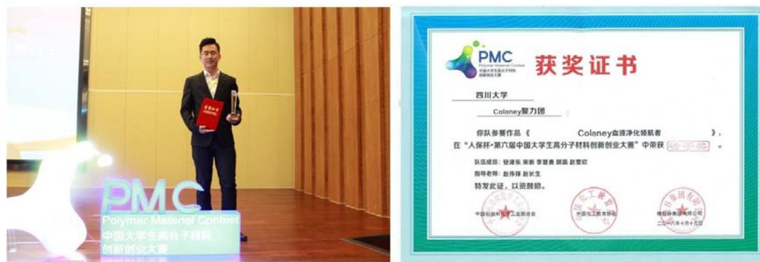
图 3. PMC 大赛获奖证书

获得二等奖，1个项目获得校级三等奖。其中，经过激烈的角逐，我院获得第四届四川省“互联网+”大学生创新创业大赛金奖1项、铜奖1项。另外，我院赵长生教授、赵伟锋副研究员指导的《Colaney血液净化领航者》项目在第六届中国大学生高分子材料创新创业大赛中荣获特等奖。