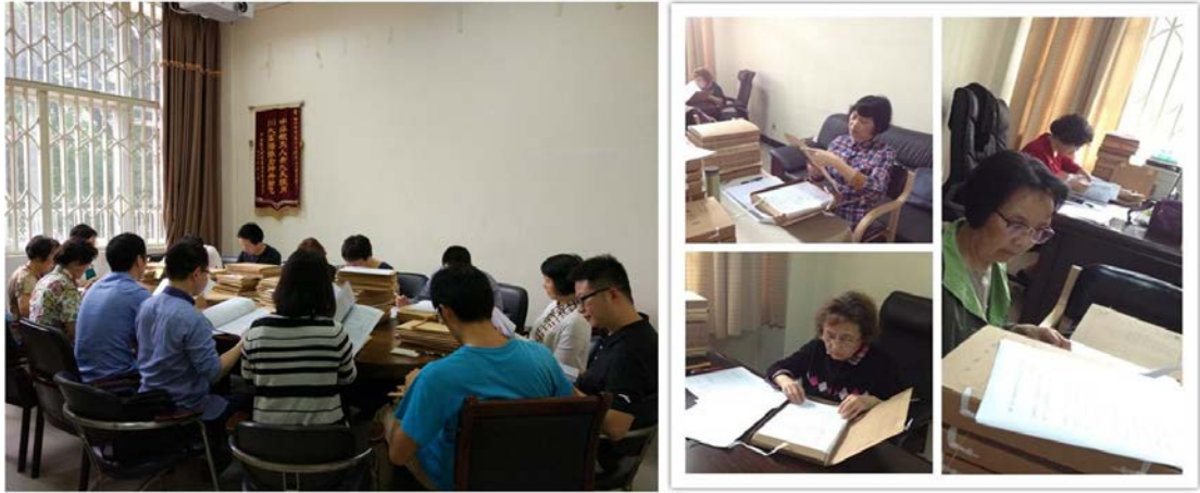
图 7. 试卷和毕业论文专项检查现场