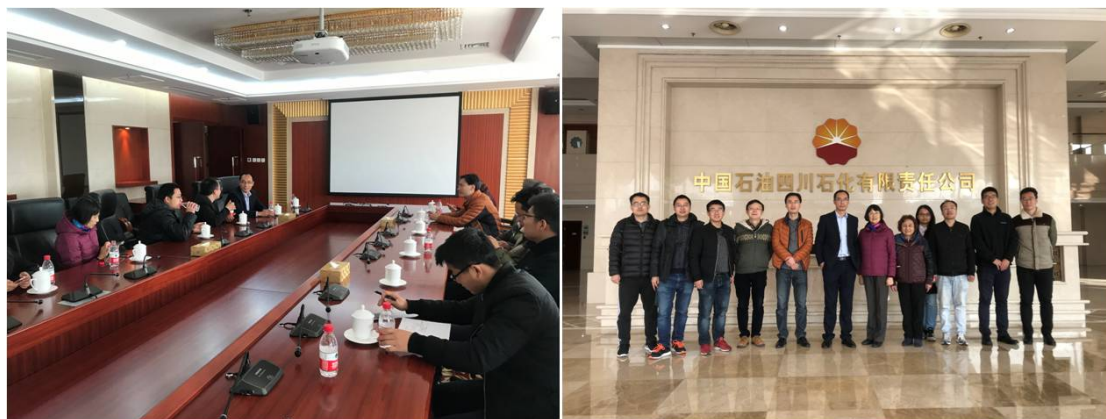
图 1. 教学研讨会现场

为大力推进教育教学改革工作，各系积极组织教师参与教育教学改革实践。2018 年我院组织思想政治教育专题研究项目结题 2 项。2018 年立项四川大学新世纪高等教育教学改革工程（第八期）研究项目 4 项和创新创业专题研究项目 2 项。我院赵伟锋老师在四川大学 2018 年青年教师教学竞赛中荣获优秀奖。