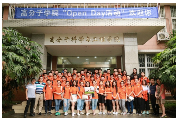
图 5. 2018 年实验室“Open Day”活动

2018年7月5日，我院开展了一年一度的实验室“Open Day”活动，组织2017级本科生到望江校区参观高分子材料工程国家重点实验室、材料科学与工程教学示范中心、各教学团队的科研实验室等，直接与教授和研究生进行面对面交流。此次“Open Day”活动让学生们对高分子学科有了直观的了解，激发了大家的专业兴趣，开阔了视野，为进一步学习专业知识和技能奠定了良好的基础，也希望学生们以此为契机，将更大的热情投入到未来的学习生活中。